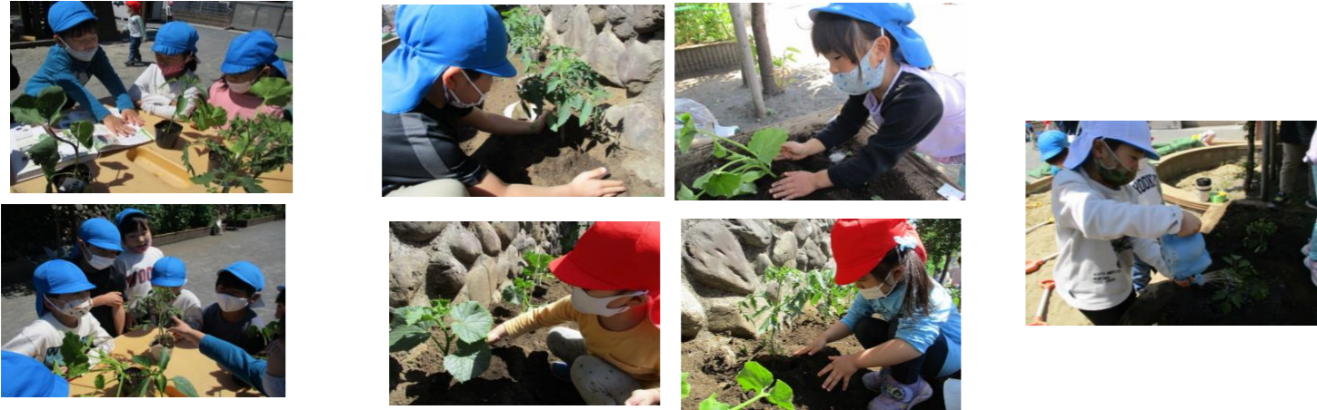
めじろ組さんも苗をわけてもらいました